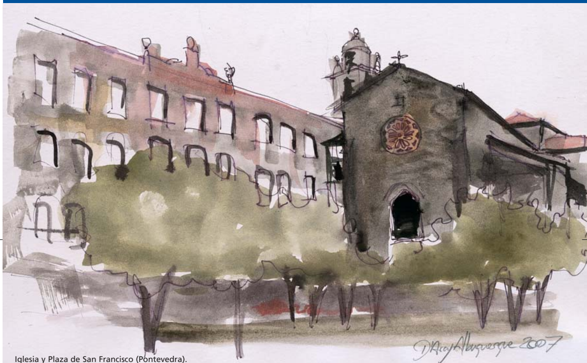
Iglesia y Plaza de San Francisco (Pontevedra).