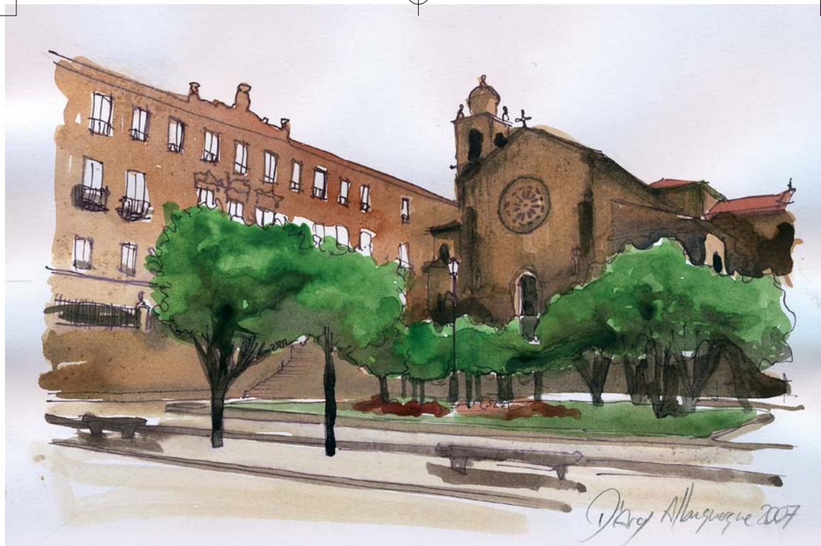
Iglesia y Plaza de San Francisco (Pontevedra).